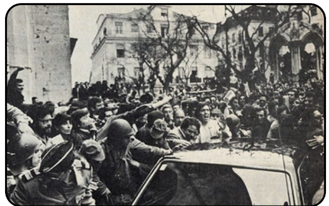
Arrivée du Général Spínola, le 25 avril 1974

Le MFA a donc facilité la transition vers un régime démocratique. Le processus long ne fut pourtant pas sans tensions : les années suivant la révolution furent marquées par des luttes entre factions politiques, des nationalisations économiques massives et le retrait difficile des colonies.