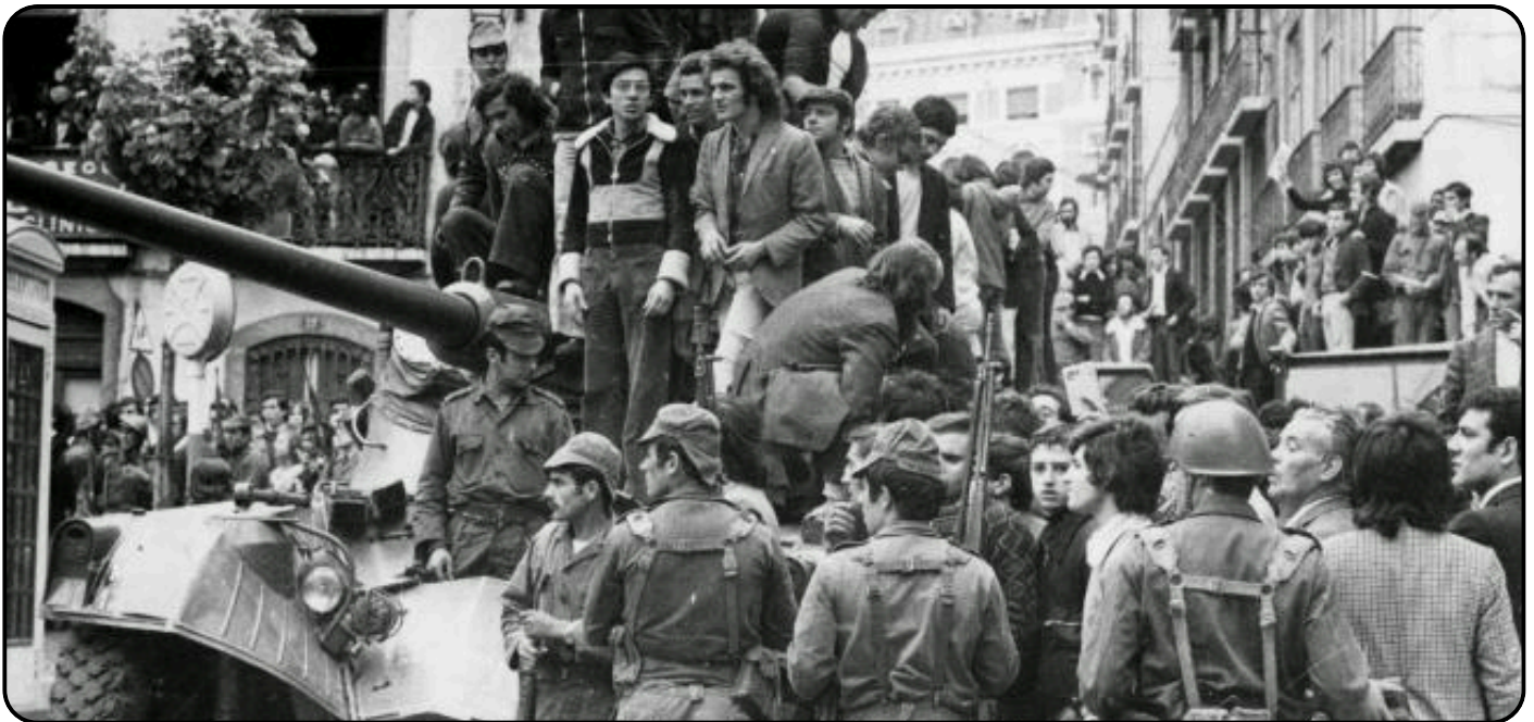
Les ouvriers et les soldats ont uni leurs forces lors de la révolution portugaise de 1974.

L'isolement politique et économique, exacerbé par des sanctions internationales, renforçait l'impression d'un régime obsolète et déconnecté des aspirations modernes. Ce manque d'accès à l'éducation et à l'information constituait un outil de contrôle du régime, mais aussi un frein à la modernisation. Cette double crise, coloniale et économique, trouvait son prolongement dans un climat de répression qui étouffait toute velléité de changement.