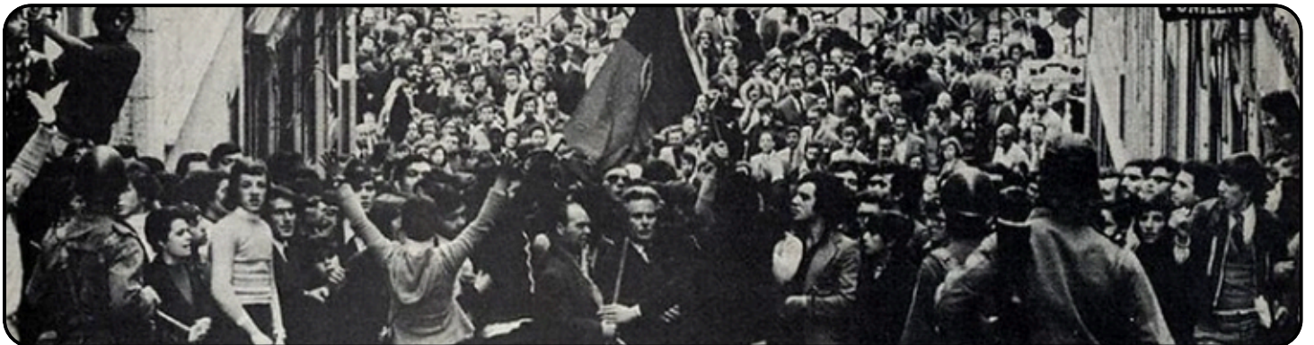
Rue de Lisbonne le 25 avril 1974

Les caractéristiques uniques de cet événement – la non-violence, un fort rejet des guerres coloniales et une culture nationale orientée vers la paix – en font une exception difficilement reproductible , à l'inverse de certains de ses modes opératoires. Les contextes récents montrent que sans volonté affirmée de remettre le pouvoir aux civils, les militaires tendent à s'installer au pouvoir. Toute tentative d'encourager un rôle positif de l'armée dans une transition démocratique doit donc être précédée d'un important travail de conviction, accompagné de garanties institutionnelles solides et d'un cadre international soutenant la transition.