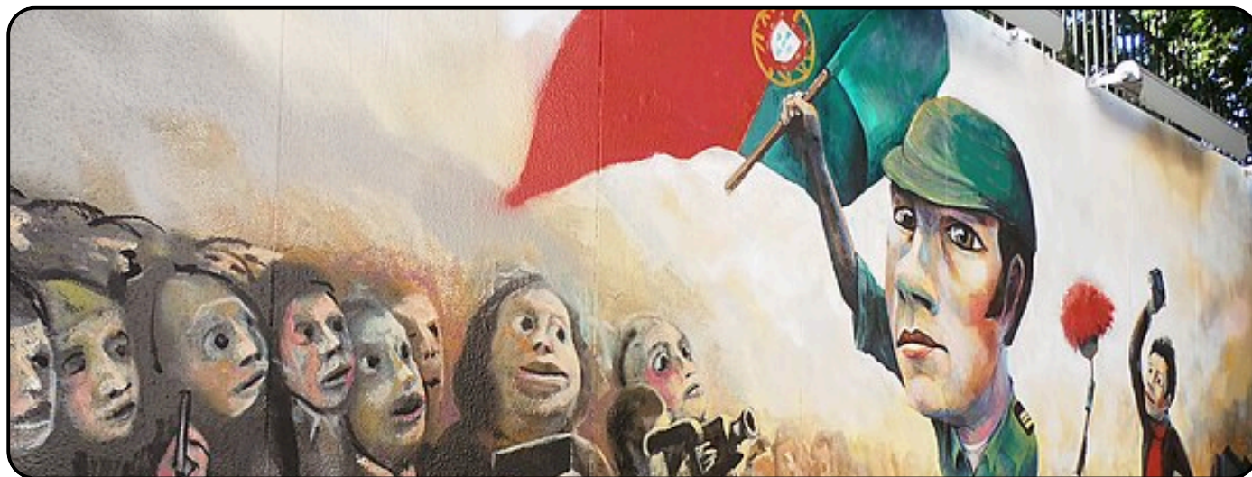
Peinture murale réalisée en 2014, 40 ans après la Révolution des œillets, à Lisbonne au Portugal