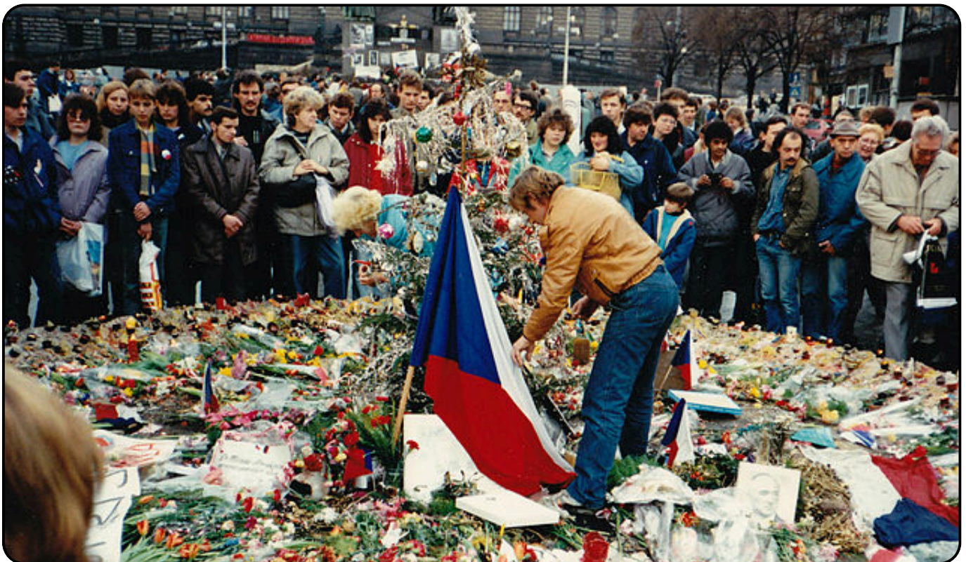
Vaclav Havel et des manifestants commémorent la lutte pour la liberté et la démocratie au mémorial de Prague lors de la révolution de velours de 1989.

Recevant un soutien international significatif, la Charte 77 se transforme rapidement en un organe semi-officiel d'opposition contre le KSČ par laquelle les intellectuels, via des bulletins d'informations, transmettent leurs opinions sur le pouvoir en place.