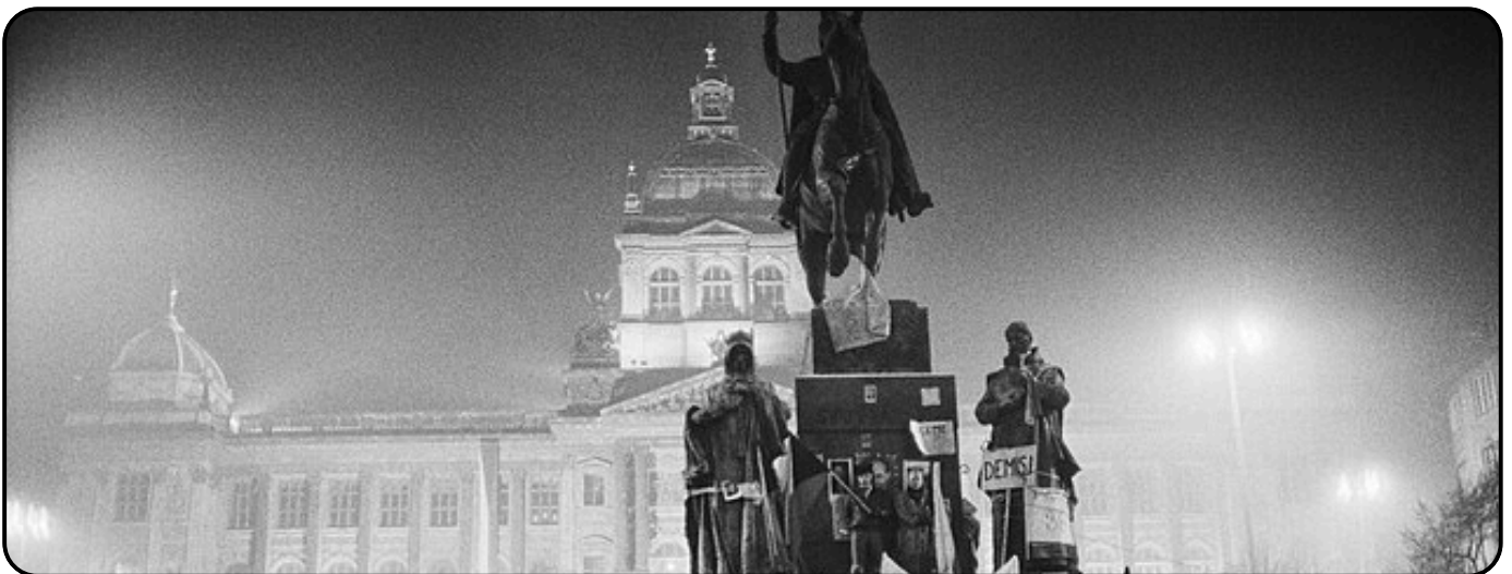
Manifestation nocturne, Novembre 1989, Prague

Il est surtout intéressant de faire un parallèle entre l'action de la Charte 77 à l'époque et des médias d'opposition aujourd'hui. Dans les deux cas, ils sont promoteurs d'opinions originales et permettent à la fois éveil des pensées et émancipation des raisons.